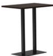
RQ Light t-2009