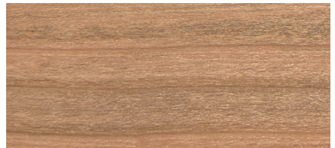
Kirsch natur, antikmatt