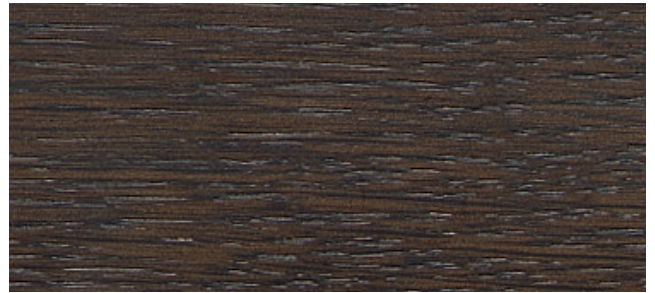
Eiche Räuchereiche, antikmatt