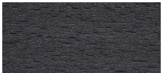
Buche anthrazit, seidenglanz