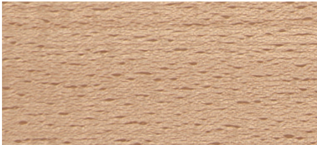
Buche natur, antikmatt