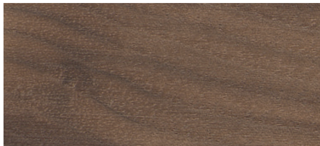
Schwarznuss natur, antikmatt