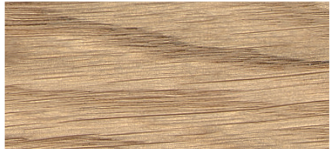
Eiche natur, antikmatt