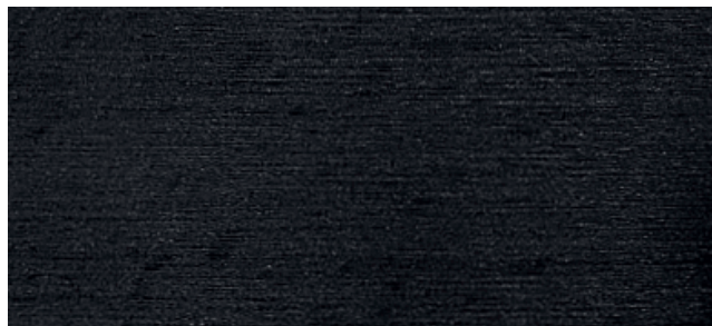
Buche schwarz, seidenglanz