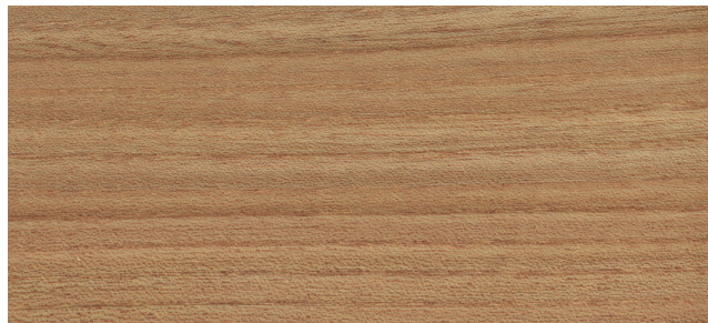
Ulme natur, antikmatt