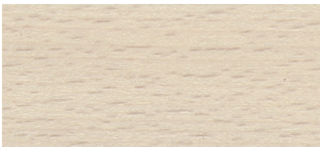
Buche geweisst, seidenglanz