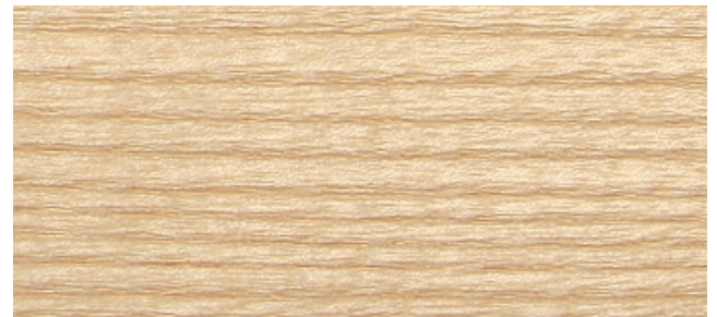
Esche natur, antikmatt