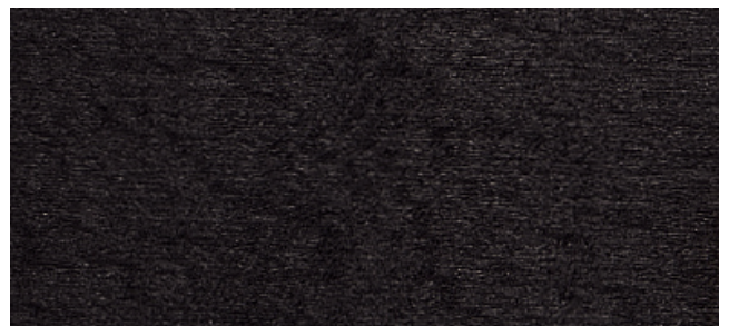
Buche Ebony, seidenglanz