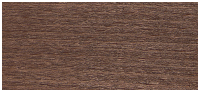
Buche Nuss, seidenglanz