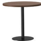
RQ Light t-2003