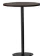
RQ Light t-2007