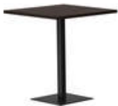
RQ Light t-2004