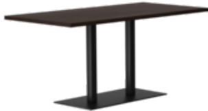
RQ Light t-2002