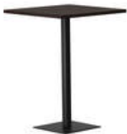
RQ Light t-2006