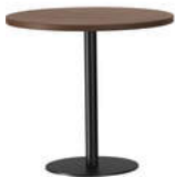
RQ Light t-2003