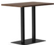
RQ Light t-2008