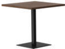
RQ Light t-2001